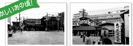
▲昭和30年頃の蒲田駅西口駅前 ▲昭和38年頃の蒲田駅西口駅前