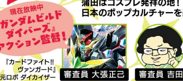
『カードファイター!! ヴァンガード』 次元ロボ ダイカイズー 審査員 大張正己 審査員 吉田正高